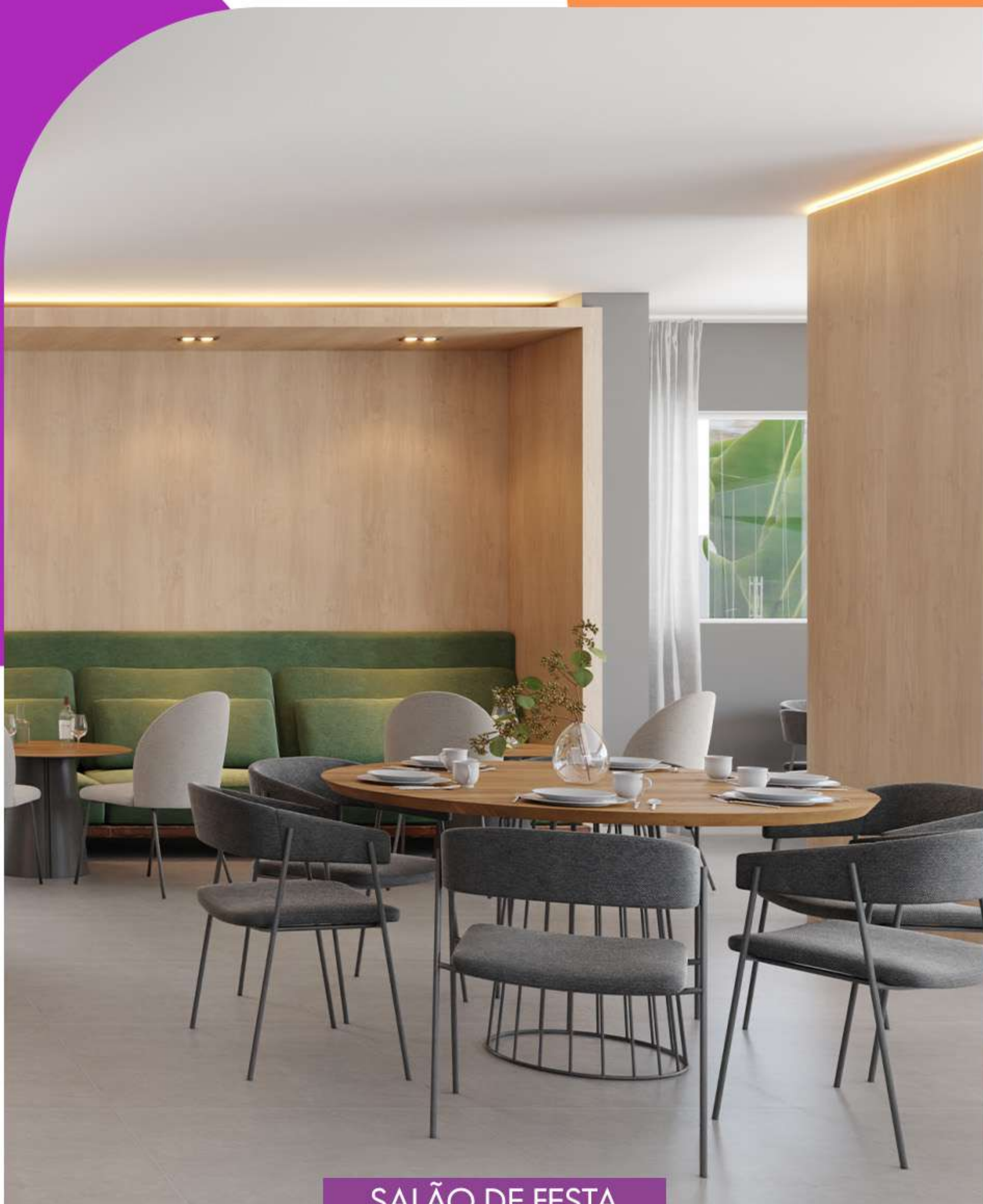
SALÃO DE FESTA