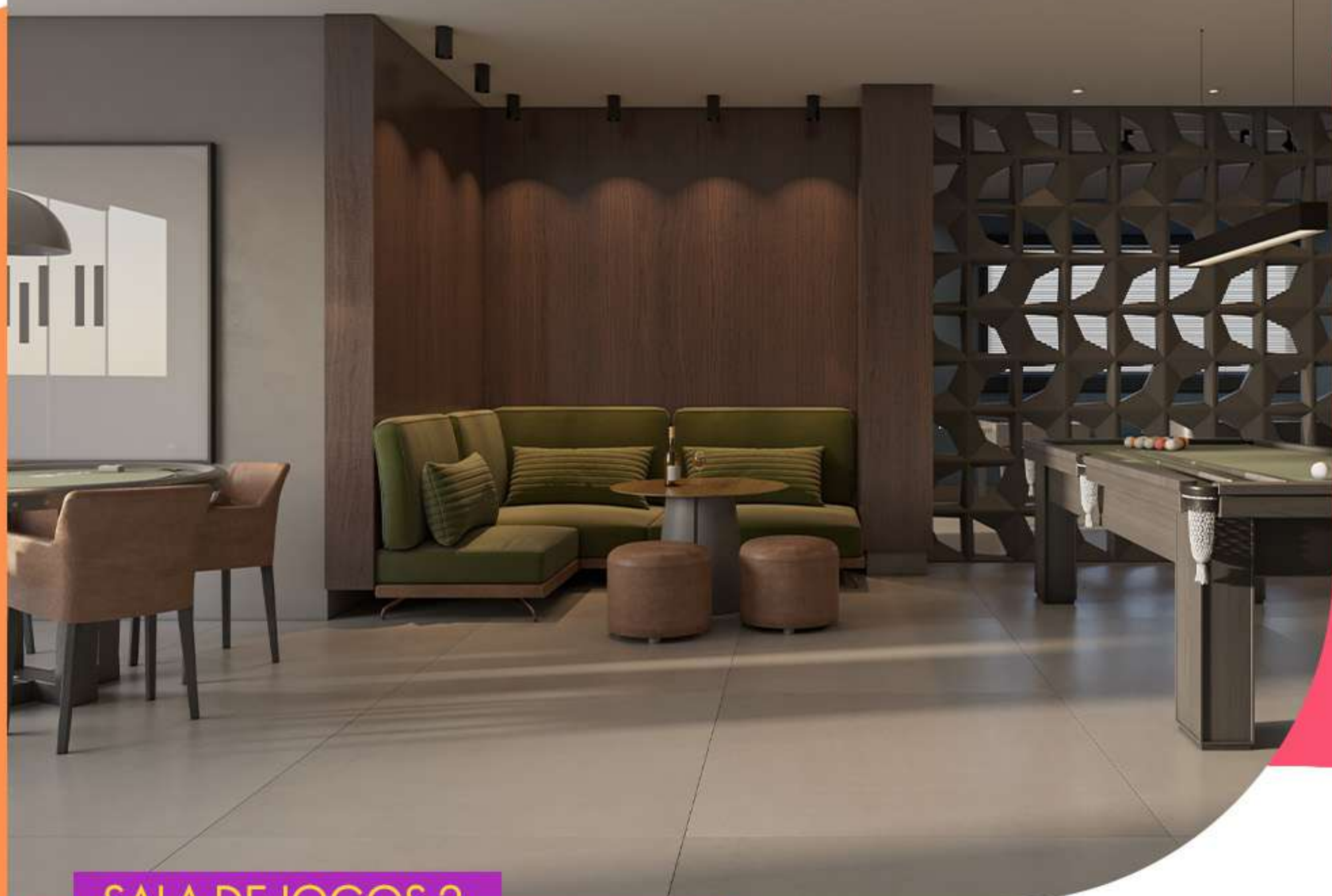
SALA DE JOGOS 2