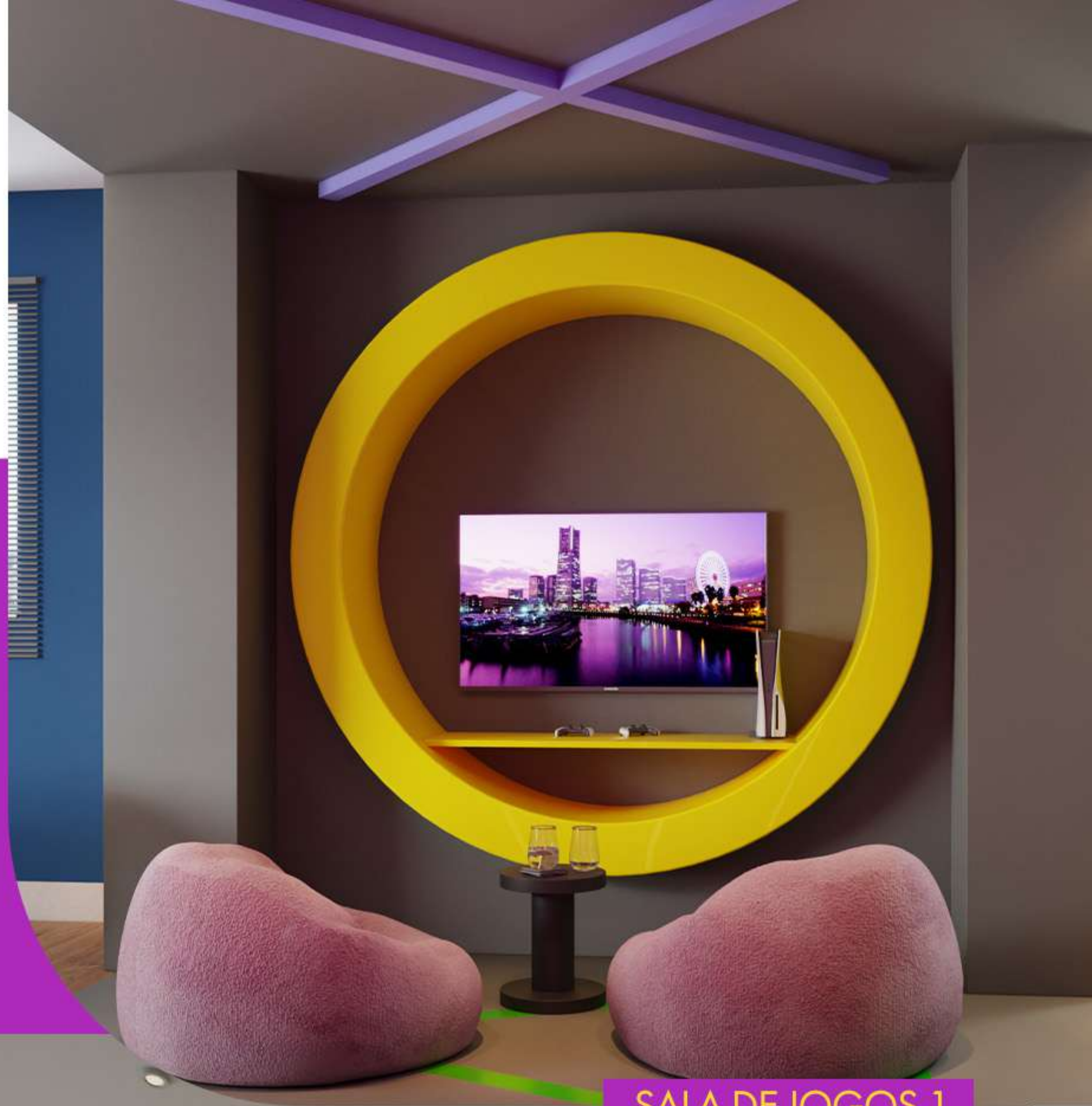
SALA DE JOGOS 1