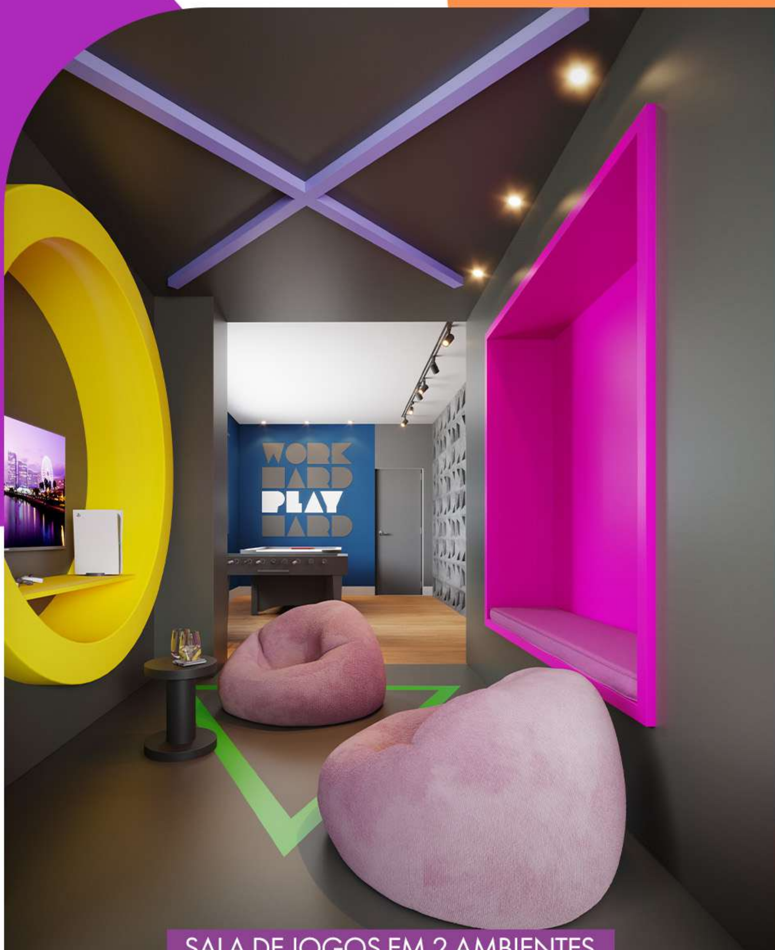
SALA DE JOGOS EM 2 AMBIENTES